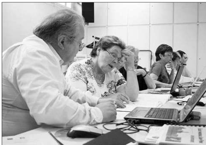
Les membres de l'Association Généalogique des Alpes-Maritimes sont venus conseiller les généalogistes locaux.

Généralement, on peut remonter jusqu'en 1792, date de la création de l'état-civil français. Mais il existe bien d'autres sources d'archives :